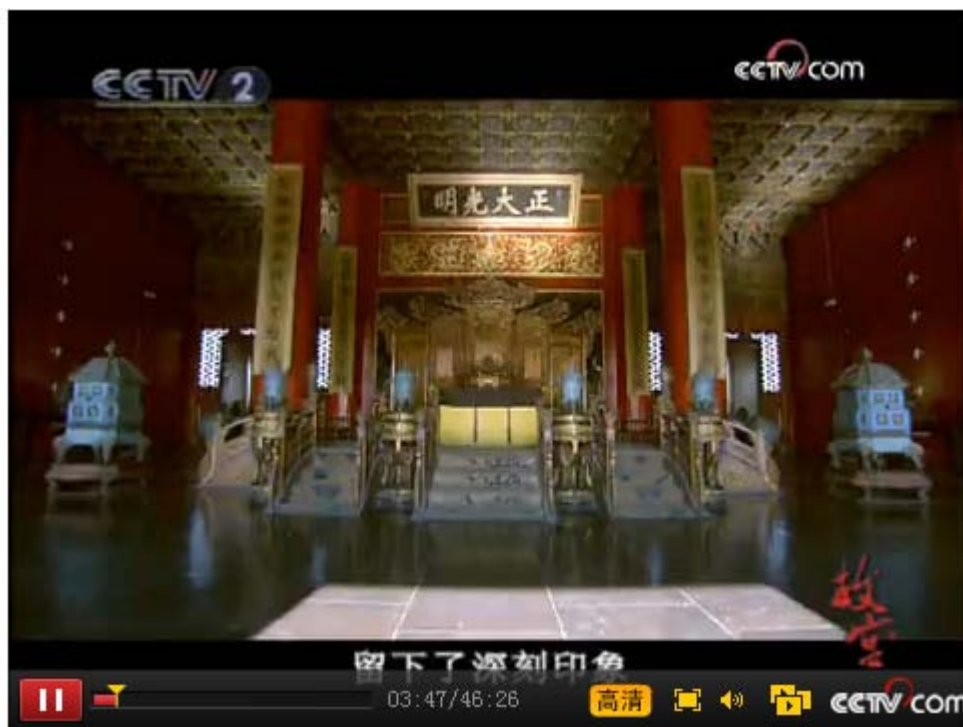
图 2:《故宫》第 2 集《故宫藏玉》

上述两个画面的构成都运用了反射在匾额上的阳光，它们分别出现在电视纪录片《故宫》的不同段落中。前者见第 3 集《礼仪天下》，摄影师采用特殊的拍摄方法记录了一年中太和殿最难得一见的景观：冬至这天，阳光可以反射到大殿正中的匾额上，自然变化与人类创造结合而成的奇特景象被忠实地记录下来，能指以消极修辞的方式被运用，起到的是再现事实的作用；后者见于第 8 集《故宫藏玉》，英国使节参观故宫宫殿的段落，强化阳光在匾额上的反射，目的不是为了强调罕见景观，而是为了表现宫殿在英国人眼中的富丽堂皇，能指以积极修辞的方式被运用，起到的是表现情感的作用。