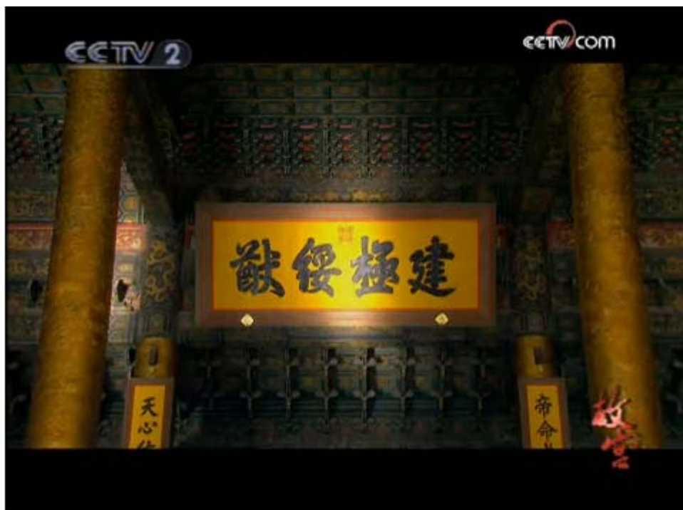
图 1：《故宫》第3集《礼仪天下》

符号学给了我们语言研究模式推广至一切符号领域的方法论启示，观察一下电视作品，可以发现电视的境界也脱离不了记述、表现和两者的糅合，而电视语言和电视符号的运用，几乎都可以纳入从消极修辞到积极修辞的序列。