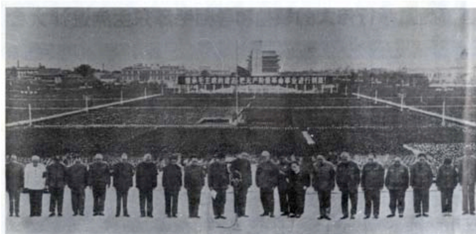
1976年9月18日北京天安門廣場追悼毛澤東逝世大會，站在第一排者是黨和國家領導人：蘇紹華、陳永貴、李國清、吳德、紀登奎、李先念、江青、張春橋、王洪文、華國鋒、葉劍英、宋慶齡、姚文元、陳錫聯、江東興、許世友、李德生、吳桂賢、倪志福（人民日報1976年9月19日）。