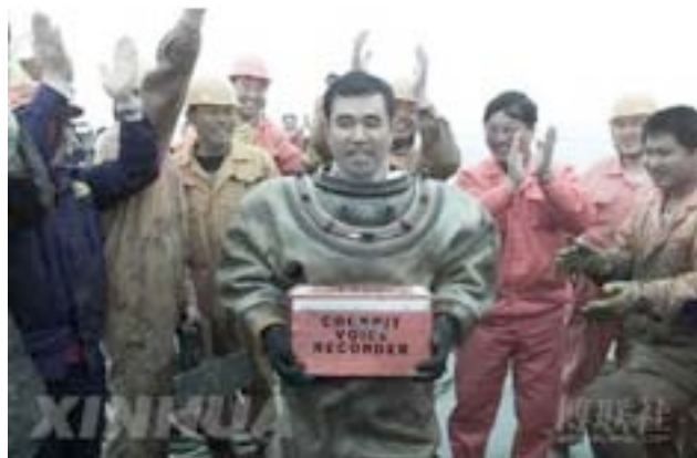
图片说明：“5.7”失事飞机第一个黑匣子（语音记录器）出水

2005年新华社的一张照片引发了一场争论，我们来看看，这是2002年5月14日新华社播发的“寻获大连5·7空难第一个黑匣子”的图片：